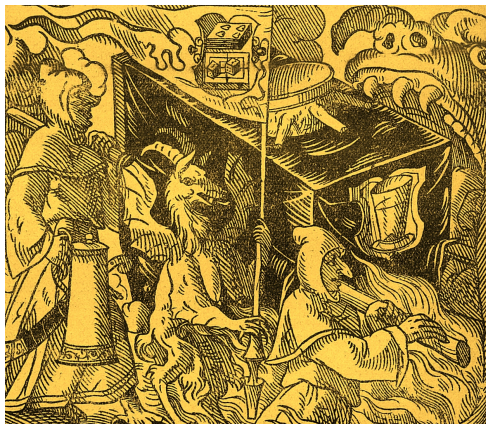
Vynášení bakusa z roku 1590