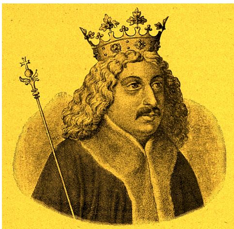
Český král Jiří z Poděbrad

Šestý lednový den přinesl svátek Zjevení Páně, který dnes nazýváme svátek Tří králů. Podle původní legendy se jednalo o tři mudrce, jež se přišli poklonit Ježíškovi a zároveň mu přinesli dary. Tento den patřil koledě v maskách, kdy koledníci od 15. století psávali svěcenou