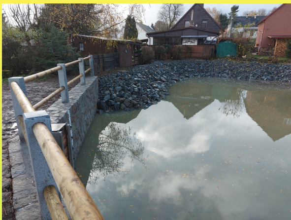
Rekonstrukce MVN v Úšavě

K posouzení byla dána studie na přechod v Úšavě a dále se bude připravovat projekční práce na komunikaci k parcelám v Úšavě. Tam má obec jen jednu parcelu, ale je nutné dle územního plánu zpřístupnit stavitelům. Projekčně se dokončuje druhá etapa komunikace v Úšavě (pod Maňovými). Na příští rok bude již vydáno stavební povolení na celkovou rekonstrukce rybníka ve Mchově, který je vypuštěn a čeká na svoji opravu. Zde bychom rádi požádali o dotaci, pokud budou v roce 2024 vypsány. Také na sběrný dvůr jsme připraveni a v lednu 2024 bude spuštěna dotace. Přípravné projekční práce jsou i na opravu mostku v Novém Sedlišti, směr k Moravcům. Zahrnuji vás informacemi přípravných prací. Studie. Projekty. Ale bez studií a projektů se dál nedostaneme. A povolení se také nevydává ze dne na den. Což ví všichni, kdo něco staví nebo stavěli.