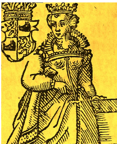
Johanka z Rožmitálu