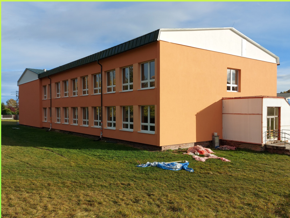
Probíhající rekonstrukce ZŠ a MŠ

Proběhla změna územního plánu č. 1, je schválena studie BI ¼ (parcely nad bývalou školkou) a studie 4 rodinných domů nad hřištěm. První se bude připravovat projekt na zasíťování 4 rodinných domů nad hřištěm.