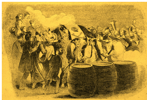
Vynášení bakusa v pivováře

Tříkrálový den byl zároveň začátkem masopustu, který se v Čechách připomíná již od 13. století. Oslavy se lišily podle krajů, ale nejveselejší bývaly poslední dny. Na masopustní čtvrtek si každý mohl dát knedlo – zelo – vepřo a zapít to pivem. Masopustní neděle lákala tím, že se po obědě začalo tancovat a na množství vypitého piva se nehledělo. Během masopustního pondělí mohly tancovat pouze sezdané páry, svobodná děvčata a svobodní chlapi mohli pouze přihlížet.