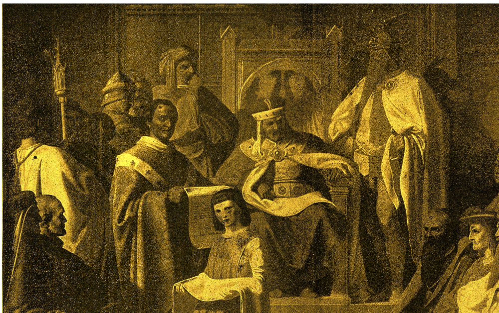
Arnošt z Pardubic v roce 1348 předčítá zakládací listinu Univerzity Karlovy

Petr Chelčický ve století patnáctém vytýká křesťanům, že se více starají o tělo, než o duši. V období adventu zase více o jídlo, než o náboženství, říkajíce „Nemáme masa jiesti, budem calty kupovati“. Caltou dlužno rozuměti pletené pečivo, kterému se později říkalo „húska“. Dnes ji nazýváme vánočkou. V 15. století zasedli lidé k večeri a poté se věnovali zábavě. Dokonce se oddávali