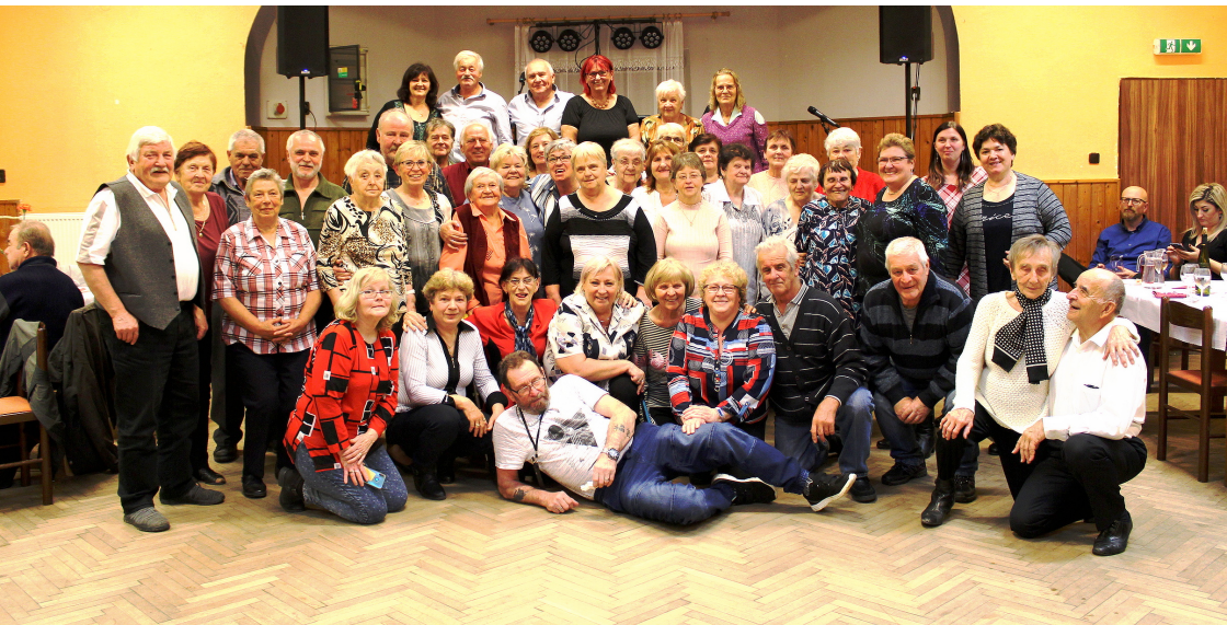
Staré Sedliště 11. 11. 2022