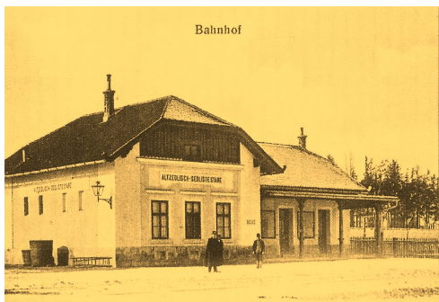
Staré Sedliště – nádraží

železniční zastávku raději přesunou do Úšavy, která byla hustě osídlena. Ani druhý pokus neprošel, a tak kolíky zaměřovacího inženýra zůstaly tam, kde stály původně. Nádraží ve Starém Sedlišti obešlo městečko širokým obloukem a původně se dotklo obytné plochy, kde stál dům č.p. 308.