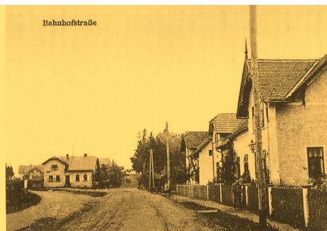
Staré Sedliště – ulice Nádražní

Ve třicátých letech dvacátého století vznikl velkolepý projekt na výstavbu koupaliště, které mělo sloužit všem vyznavačům vodních sportů. Kromě plavání mohlo sloužit i k vodnímu pólu, které se tehdy těšilo velkému zájmu. V roce 1913 se odehrál první zápas mezi AC Sparta Praha a SK Podolí. ČSR se v roce 1920 zúčastnila Olympijských her v Antverpách a utrpěla dvě porážky. Historie vodního pólu vznikla patrně v Anglii, kde v roce 1869 přišli plavečtí promotéři s myšlenkou uspořádat zápas ve vodním fotbale. Hlavním cílem bylo dát soupeři co nejvíce branek, neřešily