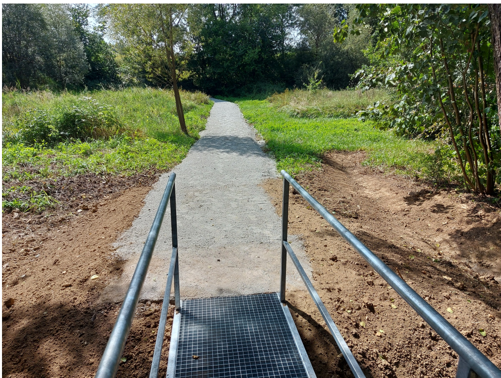
Nové Sedliště - nová lávka a cesta k židovskému hřbitovu