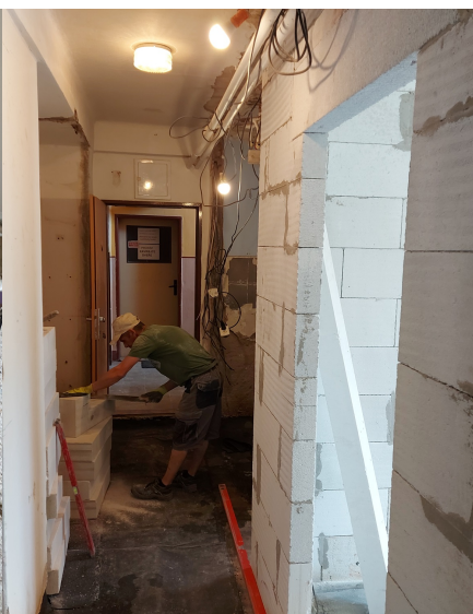
Staré Sedliště - rekonstrukce obecních bytů