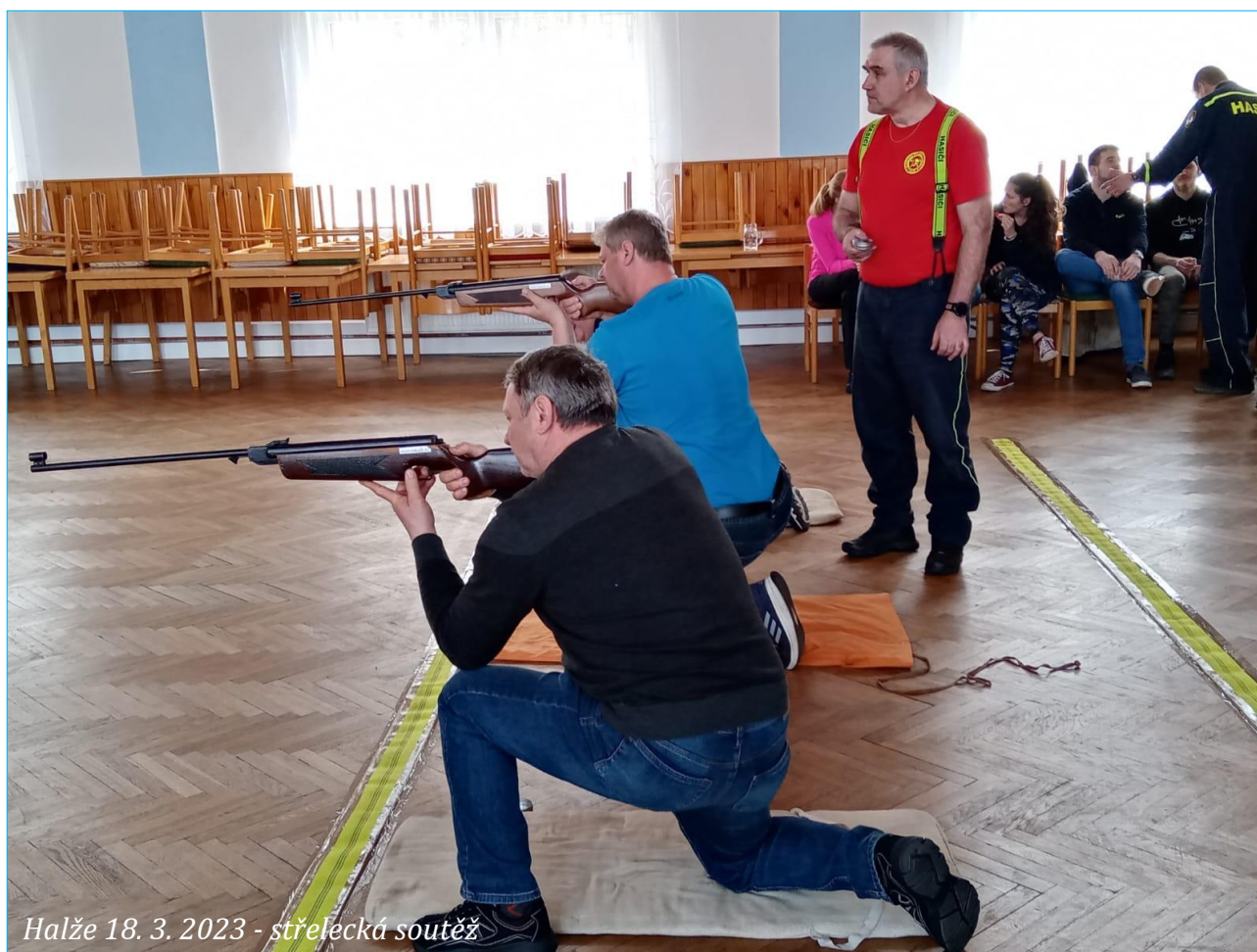
Halže 18. 3. 2023 - střelecká soutěž

Nejbližšími akcemi, které hasiči plánují ve spolupráci s Obcí Staré Sedliště, jsou