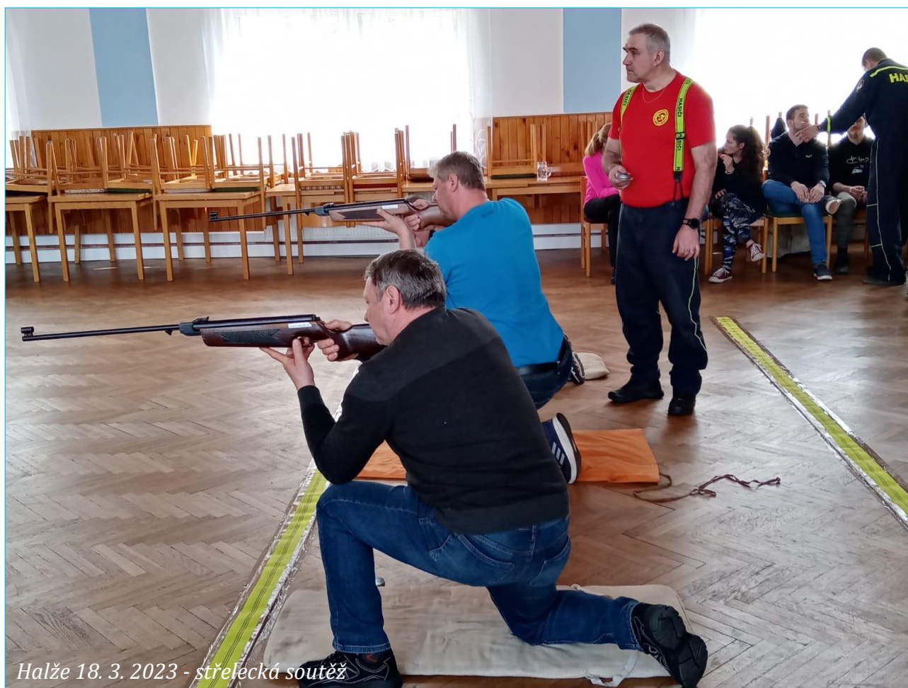
Halže 18. 3. 2023 - střelecká soutěž

Nejbližšími akcemi, které hasiči plánují ve spolupráci s Obcí Staré Sedliště jsou