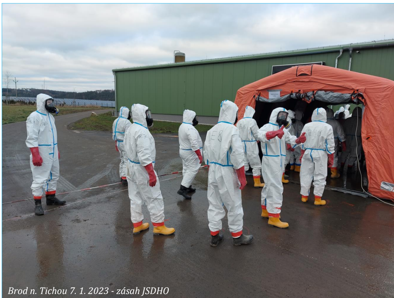
Brod n. Tichou 7. 1. 2023 - zásah JSDHO

Prostřednictvím Místní akční skupiny Český les, z.s. obdržela JSDHO v únoru nové vybavení. 80 % celkových nákladů z částky 309.700 Kč bylo hrazeno z dotace z Programu rozvoje venkova ČR, zbylých 20 % bylo